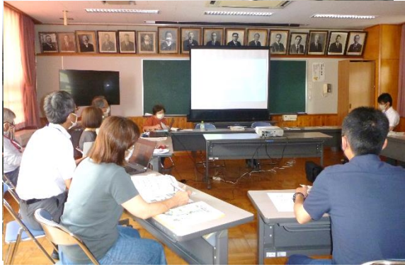
6.21(火) 庄瀬小学校会議室にて